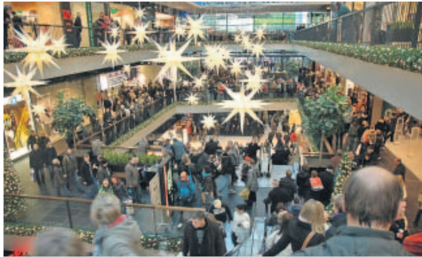
Die Galerie hat schon ihren weihnachtlichen Schmuck angelegt.