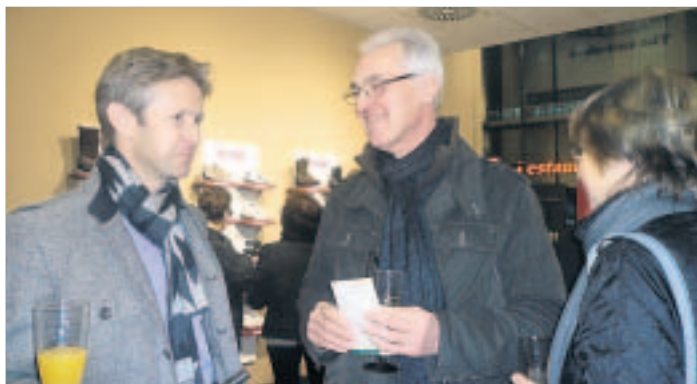
Jens Weißflog gehörte zu den Promis beim MBT-Geburtstag.