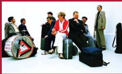
TOP DOG BRASS BAND