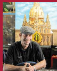
THE CELT- AIRBRUSHWORKS